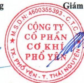
Nguyễn Đức Chung

(Các thuyết minh từ trang 10 đến trang 37 là bộ phận hợp thành của Báo cáo tài chính này.)