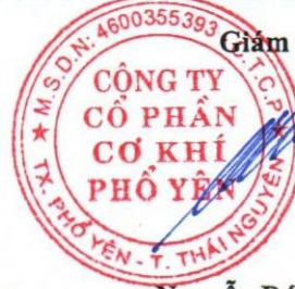
Nguyễn Đức Chung